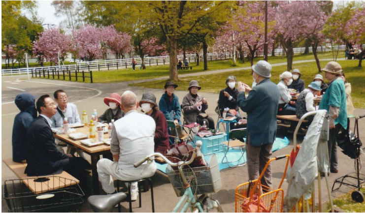
琴似班 5月7日 農試公園で 花より団子 20名参加

3月26日の西手稲健康友の会総会後、早速4月には班会や、アウトドアサークルが開催されています。 4月20日には銭函班で総会が開かれ7人が参加、健康相談会の内容や2か月に1回程度近況を兼ねてお茶を飲む交流会の開催など計画、楽しい総会となりました。 4月26日には平和班の総会が開催され12名の方が参加しました。健診や健康講座などの年間計画や会員拡大の目標を確認、総会後は親睦会を開催し、昼食をとりながら脳トレクイズやゲームなどを行い笑いの中での交流となりました。