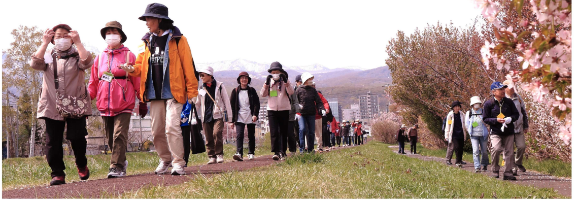
健歩会 4月27日 旧軽川緑地 桜散策 31名参加

3月26日の西手稲健康友の会総会後、早速4月には班会や、アウトドアサークルが開催されています。 4月20日には銭函班で総会が開かれ7人が参加、健康相談会の内容や2か月に1回程度近況を兼ねてお茶を飲む交流会の開催など計画、楽しい総会となりました。 4月26日には平和班の総会が開催され12名の方が参加しました。健診や健康講座などの年間計画や会員拡大の目標を確認、総会後は親睦会を開催し、昼食をとりながら脳トレクイズやゲームなどを行い笑いの中での交流となりました。