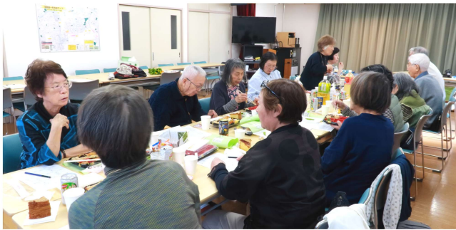
平和班 班総会後の 親睦会