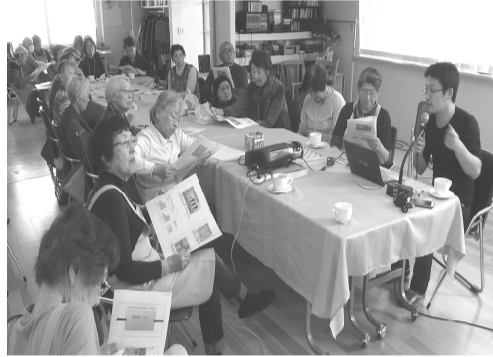
サロンひだまり。お食事会での「薬の話し」健康相談会。