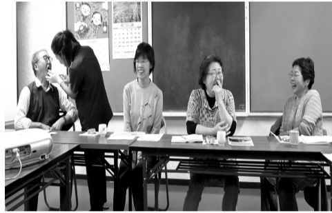
福井班。「お口の話し」にしく歯科の歯科衛生士さんによる口の乾燥度測定。参加者8名全員がクリア。

高齢者の生活がますます厳しくなる中で、「誰でも安心して住み続けられるまちづくり」が必要とされています。これを実感する地域訪問でした。 健康相談会 班では健康相談会を病院・事業所と協力して積極的に開きました。月間中で15班が開催し内容も「終末期医療」「薬の話」「お口の話し」「認知症について」など会員さんの要望を元に身近な内容でした。2つの班が合同で行ったり、お食事会での健康相談会などそれぞれの班で工夫して取り組まれました。