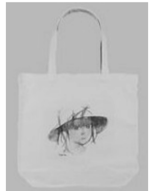
プレゼントのバック

「いわさきちひろトートバック」「挿絵&レターセット」「元気タオル」「元気トートバック」のいずれかが期間中「いつでも元気」を増やすと1人1回もらえます。