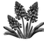
百合が原公園 ムスカリ

とき: 5月13日(水) 集合: JR学園都市線・篠路駅10時集合 行程: JR手稲駅発9:04→琴似駅9:14→桑園駅着9:17・発9:28 →篠路駅着9:45→五ノ戸森→百合が原公園探索→昼食→百合が原公園駅解散 ※ 歩行距離約4km 昼食持参、小雨決行、事前申し込み不要