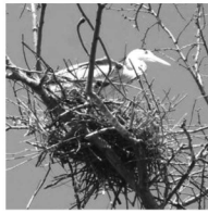
五戸ノ森緑地 アオサギ